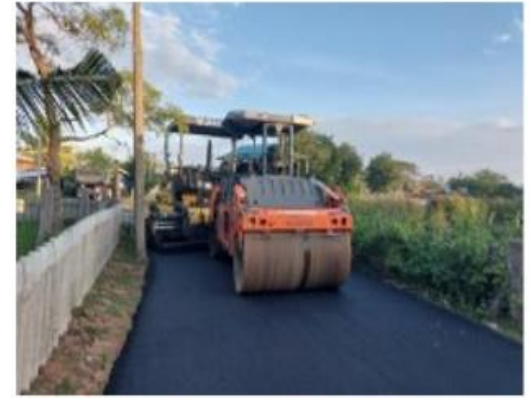
โครงการปรับปรุงผิวแอสฟัลต์ติกส์คอนกรีตบ้านดอนเค็ง หมู่ที่ 9 บริเวณถนนสายทางไปวัดบ้านดอนเค็ง