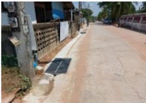
โครงการก่อสร้างถนนคอนกรีตเสริมเหล็ก (ถนนสายภายในคุ้มหนองแขงหมู่ที่ 1 บ้านหนองแจ้งใหญ่)