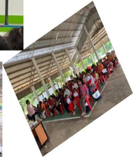
โครงการส่งเสริมสุขภาพและป้องกัน ควบคุมโรค ภายในศูนย์พัฒนาเด็กเล็กสังกัดองค์การบริหารส่วนตำบลหนองแจ้งใหญ่ ประจำปีงบประมาณ 2566 ในวันที่ 23 พฤษภาคม 2566 ณ หอประชุมอบต.หนองแจ้งใหญ่