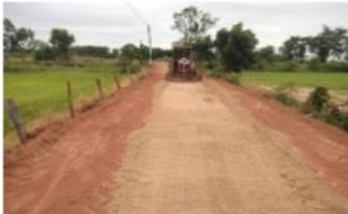
โครงการก่อสร้างถนนคอนกรีตเสริมเหล็ก ถนนสายบ้านนายสี พาสุมบูรณ์ ไปหนองโสกท้าว บ้านบุเสมา หมู่ที่ 3